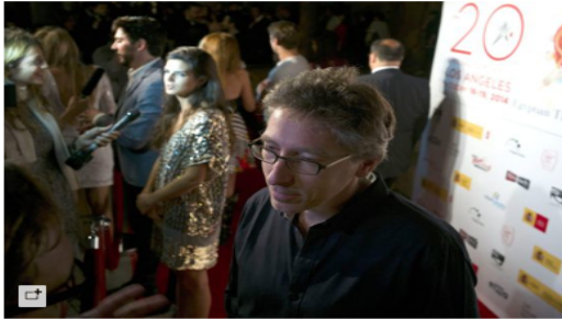
David Trueba, el jueves en el festival de cine español de Los Ángeles. Al fondo, Clara Lago y Paco León.

Archivado en: David Trueba Premios Oscar Hollywood Los Ángeles Cine americano Premios cine Academia Cine California Cine español Industria cine Estados Unidos