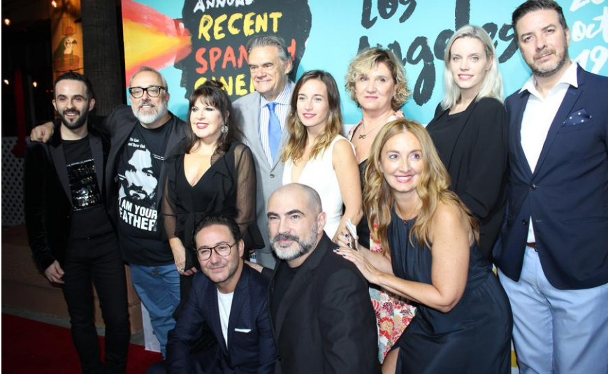
Y toda este gente tan guapa me esperaba en mi destino.

Salgo a la calle y paro un taxi. “Al Egyptian Theatre, por favor”, le digo al conductor en un inglés con un perfecto acento manchego. Tres cuartos de hora más tarde y tras haber pasado media en un atasco, consigo llegar a mi destino. Pongo un pie en la acera y me doy cuenta de que estoy en la estrella de la fama de Cate Blanchett. ¡He pisado a la ganadora de dos premios Oscar! Le pido perdón mentalmente y miro hacia arriba. Allí está, el teatro egipcio en todo su esplendor. He de decir que me lo esperaba más grande y que me recuerda un poco a Terra Mítica. Pero estoy en Hollywood Boulevard y eso es todo lo que me importa right now .